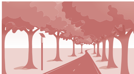
Ubicazione non adatta

Gli apparecchi di illuminazione autonomi, detti in breve solari, si distinguono dai tradizionali apparecchi di illuminazione principalmente per l'indipendenza dalla rete elettrica e la differente forma. L'indipendenza dalla rete permette a chi lo utilizza di avere una grande flessibilità grazie all'assenza di cablaggio a terra e pali. È importante che l'ubicazione sia adatta: con forti ombreggiamenti, causati ad esempio da alberi (immagine sotto a sinistra), l'applicazione di apparecchi di illuminazione solari non è sensata.